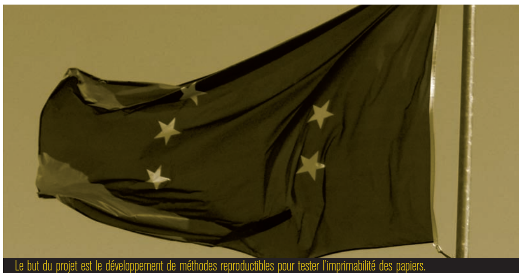
Le but du projet est le développement de méthodes reproductibles pour tester l'imprimabilité des papiers.

PrintIP est le nom d'un consortium formé par cinq organismes de recherche en Europe pour mettre en place des tests visant à éliminer les problèmes majeurs d'impression. Développé dans le cadre du programme européen CORNET*, PrintIP a pour ambition de fédérer des centres de recherche autour de projets à destination des entreprises.